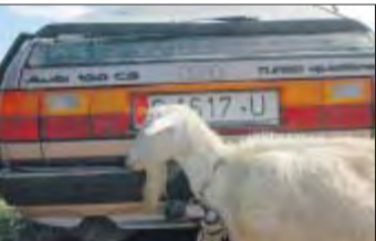
Auf dem Viehmarkt darf die Ziege auch ins Auto einsteigen.

dische Privatinvestoren anzuziehen, ist wirtschaftlich aber wenig attraktiv. Hauptexportgut sind Bodenschätze, vor allem durch Wasserkraft erzeugte Energie und Gold. Allerdings fließen wegen Korruption viele Einnahmen in private Taschen. Haupt-