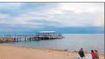
Einsamer Strand am Issyk-Kul, der 1600 Meter hoch liegt.

erwerbszweig ist die Landwirtschaft. Erzeugt wird vor allem Getreide, Fleisch, Honig, Obst und Gemüse, wegen der Gebirge kann der Eigenbedarf an Lebensmitteln nicht gedeckt