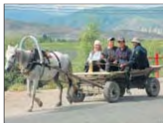
Wie früher zieht man mit Pferd über die Straßen und die Äcker.

Heute liegt die Auslandsverschuldung bei über 100 Prozent des Bruttoinlandsprodukts. Durch den Beitritt zur Welthandelsorganisation geriet der Binnenmarkt stärker unter den Druck des Weltmarkts. Die Industrieproduktion sank um 70 Prozent. Kirgistan bemüht sich, auslän-