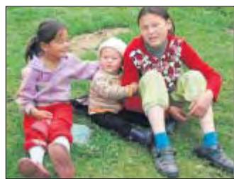
Unbekümmert leben die Kinder im Nomadenlager in den Bergen.

Der Name Kirgistan bedeutet Platz (Stan) der Kirgisen. Deswegen sagt man auch Kirgisistan, früher hieß es Kirgisien. Es grenzt im Norden an Kasachstan, im Westen an Usbekistan, im Südwesten an Tadschikistan und