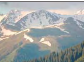
Die Gipfel des Tien Shan sind auch im Sommer schneebedeckt.

im Südosten an China. Von den rund 5,36 Millionen Einwohnern sind 70 Prozent Kirgisen, hinzu kommen rund 80 verschiedene Nationalitäten. Als erste Republik erklärte Kirgistan am 31. August 1991 seine Unabhängigkeit von der Sowjetunion.