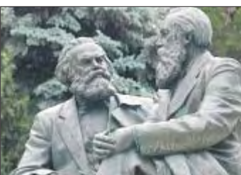
Marx und Engels in Bischkek im Gespräch über eine Kirgistan-Lösung?

werden. Im Sommer leben viele Kirgisen in Jurten aus Filz in den Bergen. Wobei auch die Stadtbewohner zu wichtigen Familienanlässen wie Geburt oder Begräbnis noch Jurten vor ihren Häusern aufbauen. Ein traditionelles Getränk ist Kymys. Es wird