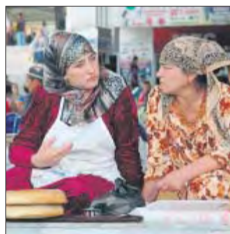
Auf dem Basar in Samarkand.

ein Jointventure mit einer US-Firma gewonnen. Wichtigster Exportgut ist die Baumwolle. Daneben spielt die