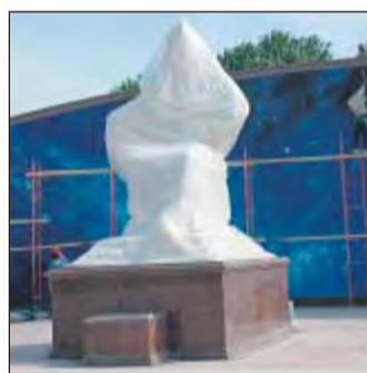
Der verhüllte Ulugh'bek.

tan. Erdgas wird in Gasli weit von Buchara gefördert. In den Bergregionen und der Wüste Kizilkum werden jährlich etwa 70 Tonnen Gold durch