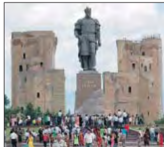
Timur vor seinem Palast.

triebe wurde nur teilweise durchgesetzt. In Usbekistan leben heute rund 27,3 Millionen Menschen, die meisten auf dem Land. 90 Prozent sind sunnitische Muslime. Viele Mo-