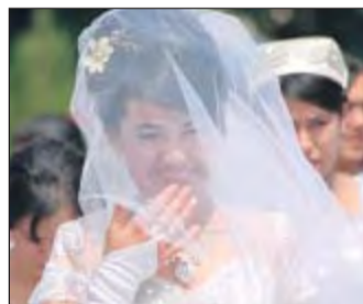
Glückliche junge Braut.

wirtschaftliche Selbstständigkeit sind. Größere Industriebetriebe gibt es bei den Erdöllagerstätten im Ferganabecken an der Grenze zu Kirgis-