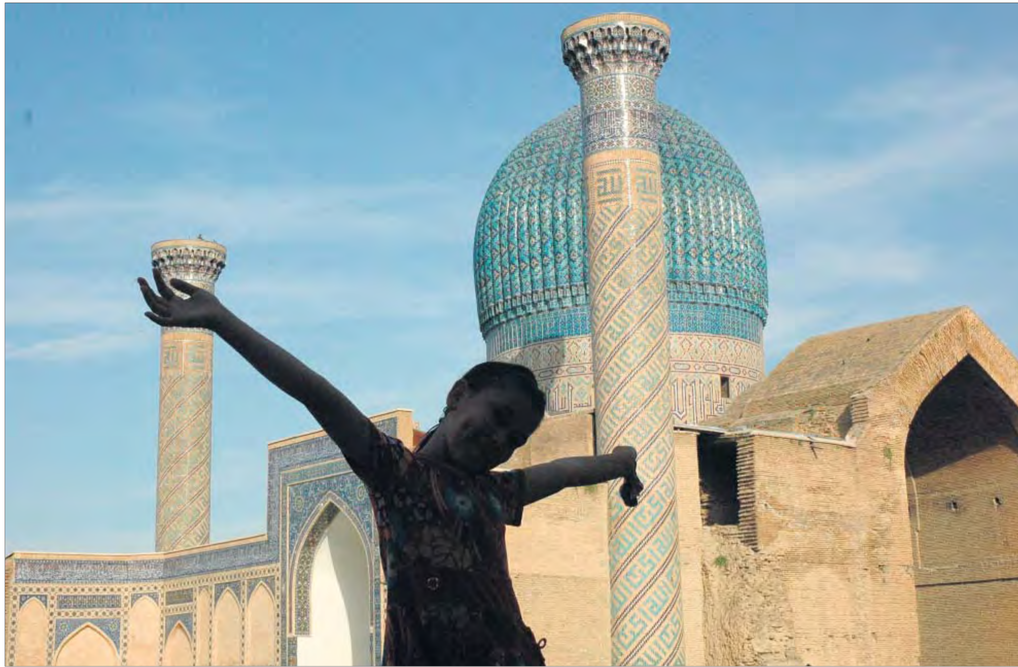
Ein lebendiges „Märchen aus Tausendundeiner Nacht“ – eine von Scheherezades Töchtern vor dem Timuriden-Mausoleum Gur Emir in Samarkand.

scheen und Medresen wurden seit der Unabhängigkeit neu eröffnet. An den islamischen Hochschulen herrscht reger Betrieb. Praktiziert wird gemäßiger Islamismus.